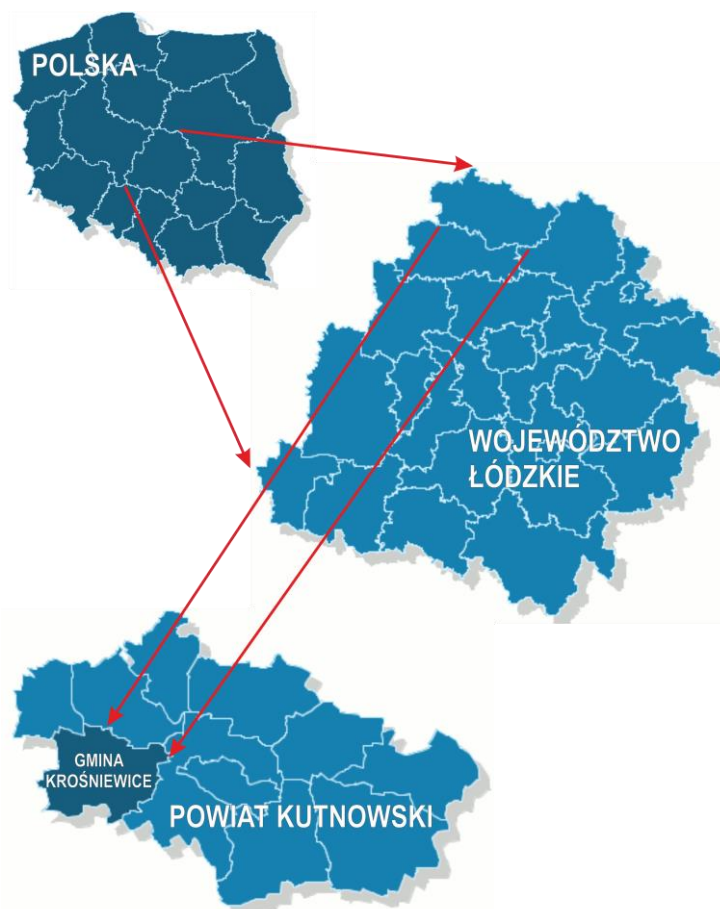
Rysunek 2. Teren gminy Krośnice na tle powiatu, województwa i kraju.

Wnioski do planu sformułowano w oparciu o zapewnienie podstawowego funkcjonowania i ochrony terenów najcenniejszych przyrodniczo na omawianym obszarze i w jego otoczeniu oraz zgodności projektu planu ze wskazaniami zawartymi w opracowaniu ekofizjograficznym.