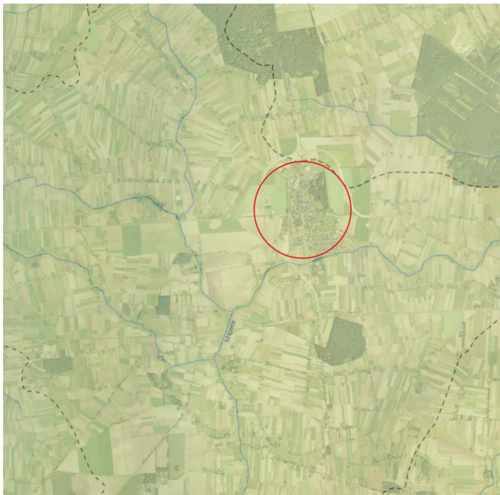
Rys. 5. Położenie terenu opracowania na tle JCWP, źródło: http://geoportal.kzgw.gov.pl/imap/

Teren miasta odwadniany jest przez rzekę Miłonkę (Jednolite części wód powierzchniowych) oraz rowy melioracyjne. Rzeka Miłonka przepływa południowym skrajem miasta mało wyrazistą doliną. Wody stojące na terenie miasta reprezentowane są przez stawy mające naturalne zasilanie z sieci rzecznej, ale także z płytkich wód gruntowych. Kilka stawów znajduje się przy dawnym zespole dworsko-parkowym w mieście.