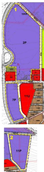
Rysunek 1. Tereny mpzp w obowiązującym planie

Przedmiotem opracowania jest prognoza oddziaływania na środowisko zmiany miejscowego planu zagospodarowania przestrzennego, wykonanego zgodnie z uchwałą Nr XI/61/15 Rady Miejskiej w Krośniewicach z dnia 7 września 2015 r. w sprawie przystąpienia do sporządzenia zmiany miejscowego planu zagospodarowania przestrzennego dla części miasta Krośniewice obejmującej rejon ulic: Poznańskiej i Kutnowskiej.